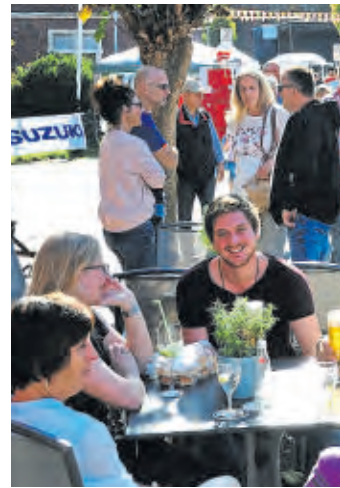
Einen Markt wird es wegen Corona nicht geben – die Gastronomen haben jedoch leckere Überraschungen vorbereitet.

Wie aus dem Rathaus verlautete, werden am Sonntag eine Reihe von Verwaltungsmitarbeiter in der City von Velen im Einsatz sein, um darauf zu achten, dass sich nicht zu viele Menschen gleichzeitig an einer Stelle aufhalten.