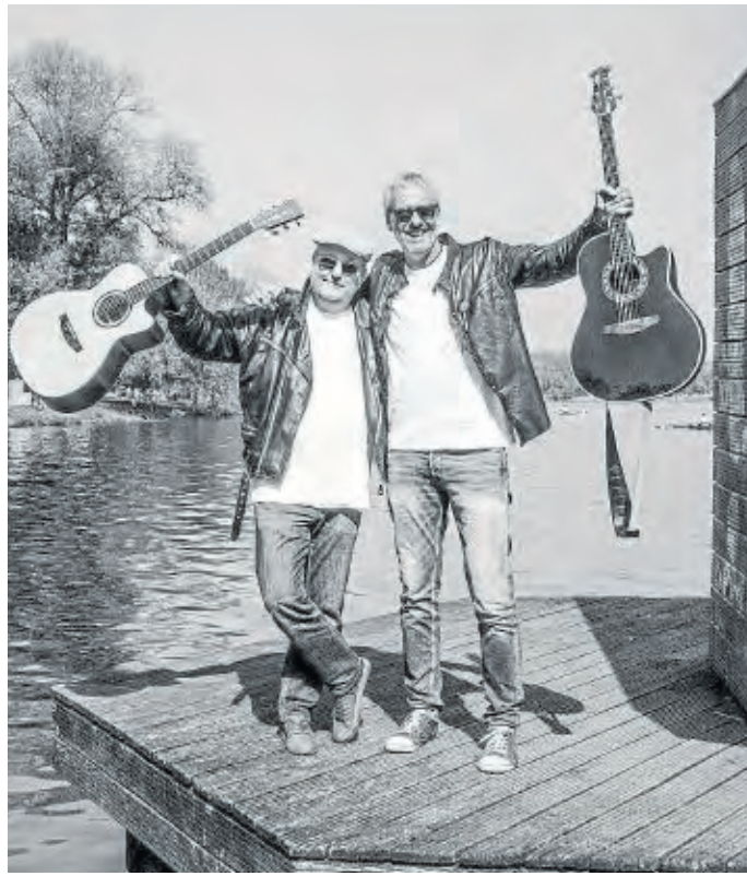
Das Duo Schallermann sorgt für musikalische Unterhaltung.

Nachdem die Kolle Kaermes in ihrer traditionellen Form aufgrund der Corona-