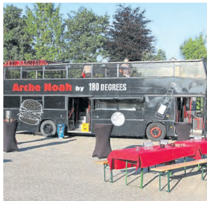
Steht am Sonntag von 13 bis 18 Uhr auf dem Leinenweberplatz: Der Foodtruck „Arche Noah“ von 180 Degrees.

Verkaufsoffener Sonntag in der Innenstadt von 13 bis 18 Uhr / Rahmenprogramm auf dem Leinenweberplatz