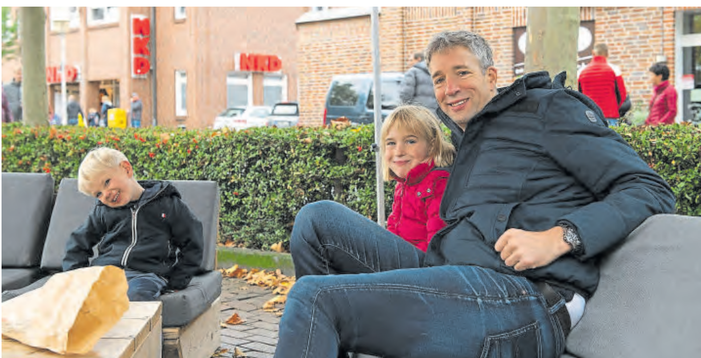
Der verkaufsoffene Sonntag ist etwas für die ganze Familie.

Auch die Gastronomie der Stadt hat sich auf den verkaufsoffenen Sonntag bestens vorbereitet. So steht beispielsweise der Doppeldecker Food-Bus des Restaurants 180 Degrees namens „Arche Noah“ auf dem Leinenweberplatz. Burger, Pommes und Currywurst hat der Fastfood-Anbieter im