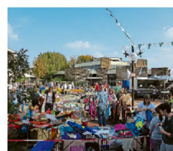
Rund 50 Stände locken zum Bummeln ein.