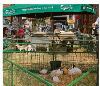
Nicht nur für die kleinen Besucher: ein Streichelzoo.

Ein herbstlicher Ausflug nach Heiden lohnt sich an diesem Wochenende bestimmt für die ganze Familie.