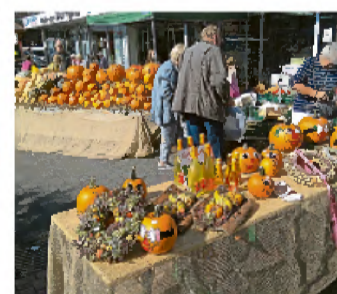
Kürbiskreationen gibt es auf dem Heidener Herbst zu bewundern.