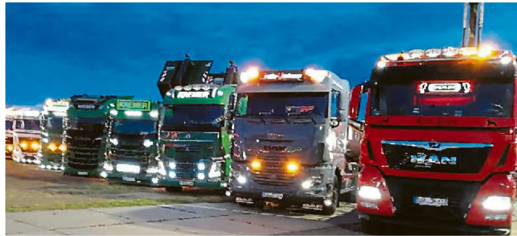
Das 1. Heidener LKW Charity Event ist gestern gestartet.