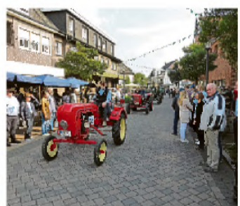
Die Heidener Treckerfreunde sind auch wieder mit dabei.